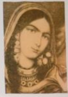
Padmini was a legendary 13th-14th century Indian queen.