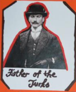
Father of the Turks