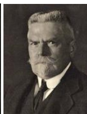
| Karel .....