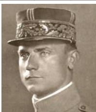
| Milan Rastislav ...