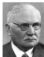
| Vavro ...