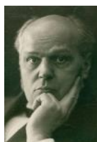
| Antonín ...