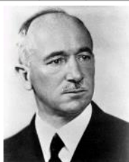
| Edvard .....