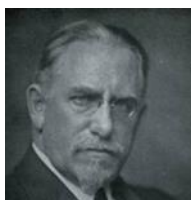
| František ...