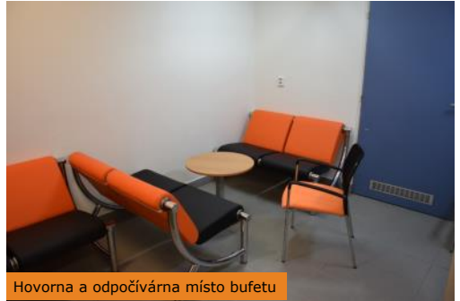
Hovorna a odpočívárna místo bufetu