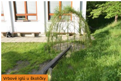
Vrbové iglú u školičky