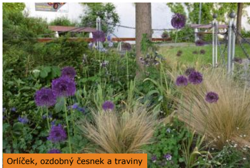
Orlíček, ozdobný česnek a traviny