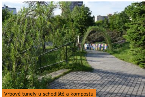
Vrbové tunely u schodiště a kompostu