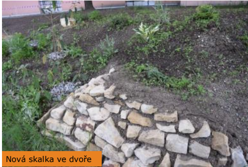
Nová skalka ve dvoře