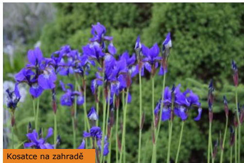
Kosatce na zahradě