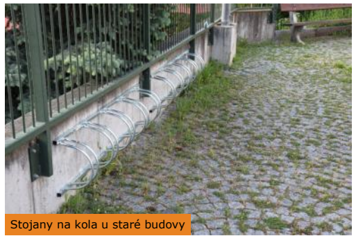
Stojany na kola u staré budovy