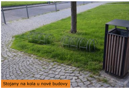
Stojany na kola u nové budovy